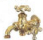
ニロ万能銅長水栓